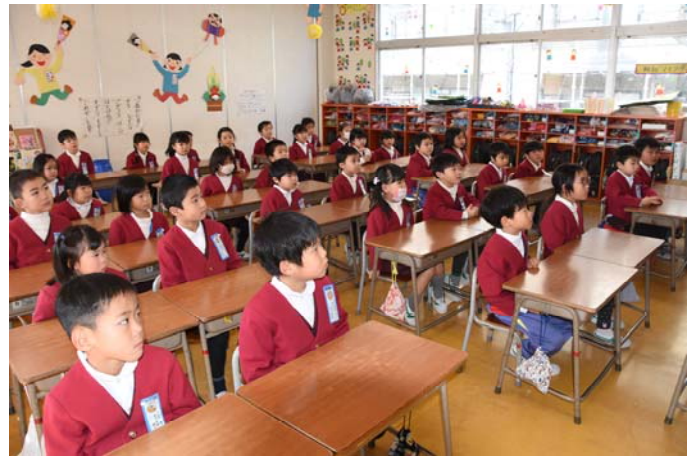
↑ 心を込めて真剣に聞く子供達