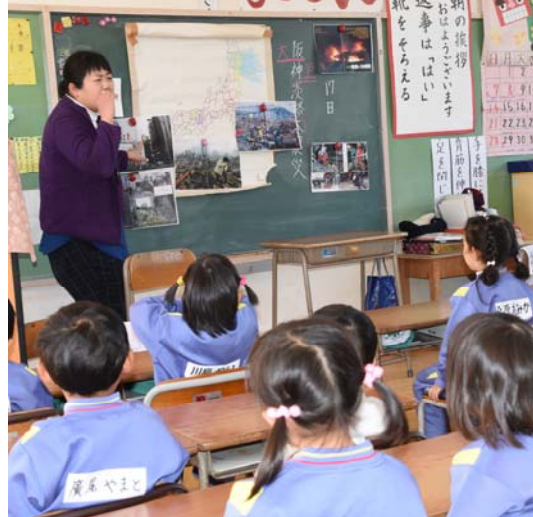
← 年少3歳児の防災教育です