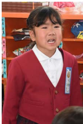
↑ 自分の思いを発表する5歳児です