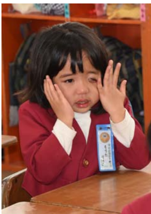
↑ 先生の話が5歳児の心に届きました