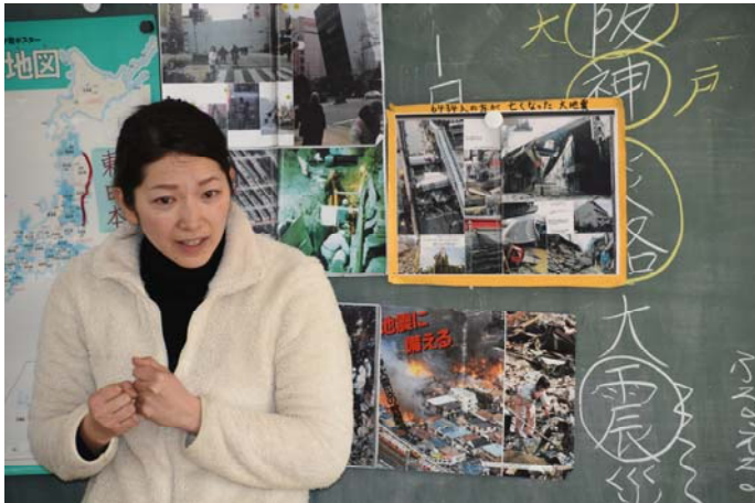
↑ 年長5歳児の防災教育です